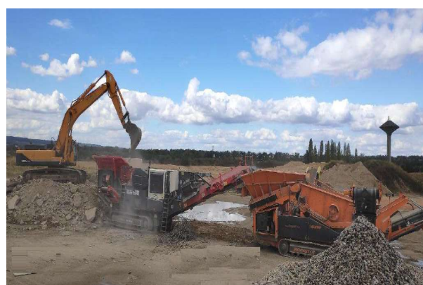
atelier de concassage mobile 1