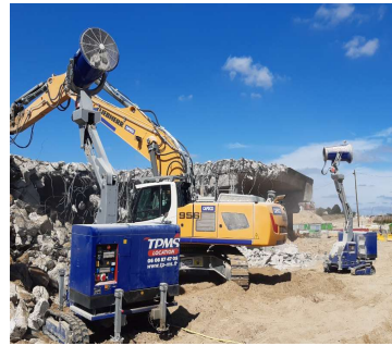
canons de brumisation sur le chantier