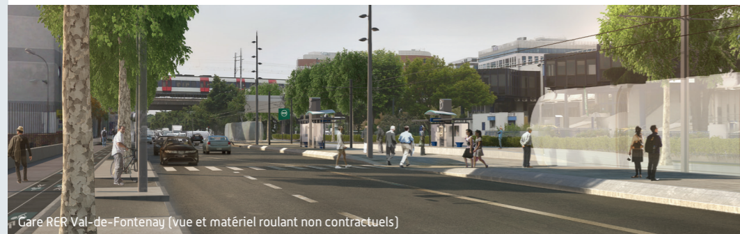
Gare RER Val-de-Fontenay (vue et matériel roulant non contractuels)