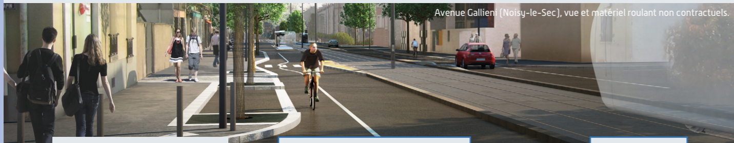
Avenue Gallieni (Noisy-le-Sec), vue et matériel roulant non contractuels.

Nous informerons les riverains et l'ensemble de la population concernée de chacune de ces phases. Il faut considérer l'ensemble des intérêts des riverains et des personnes qui traversent le territoire. Les commerçants, les riverains, les scolaires, les automobilistes, les voyageurs des transports en commun sont autant