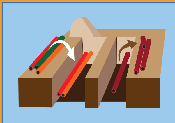
2 Déplacements et modernisation des réseaux, et déviation sous les trottoirs ou sous la chaussée.