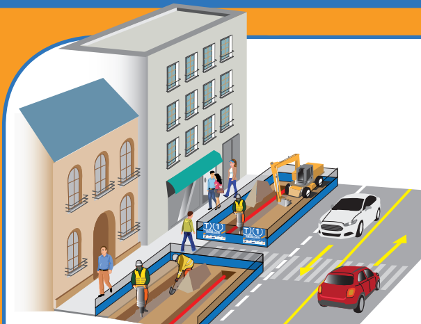
1 Creusement des tranchées, avec le cas échéant, consolidation des parois.