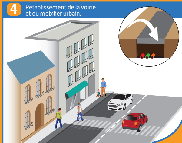
4 Rétablissement de la voirie et du mobilier urbain.